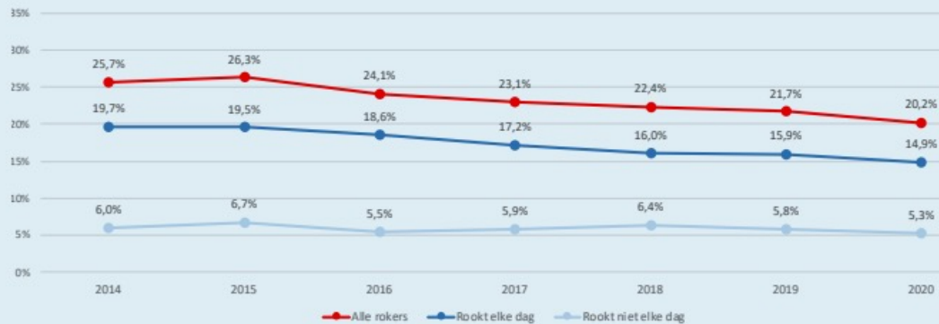
Figuur 2. Percentage rokers per jaar onder volwassenen.

Uitleg: Het percentage rokers onder volwassenen is tussen 2014 en 2020 significant* gedaald. Ook het percentage mensen dat elke dag rookt is in die periode significant gedaald. Tussen 2019 en 2020 daalde het totale percentage rokers wel significant, maar het percentage dagelijkse rokers niet. Het percentage niet-dagelijkse rokers is niet significant veranderd over de jaren heen.