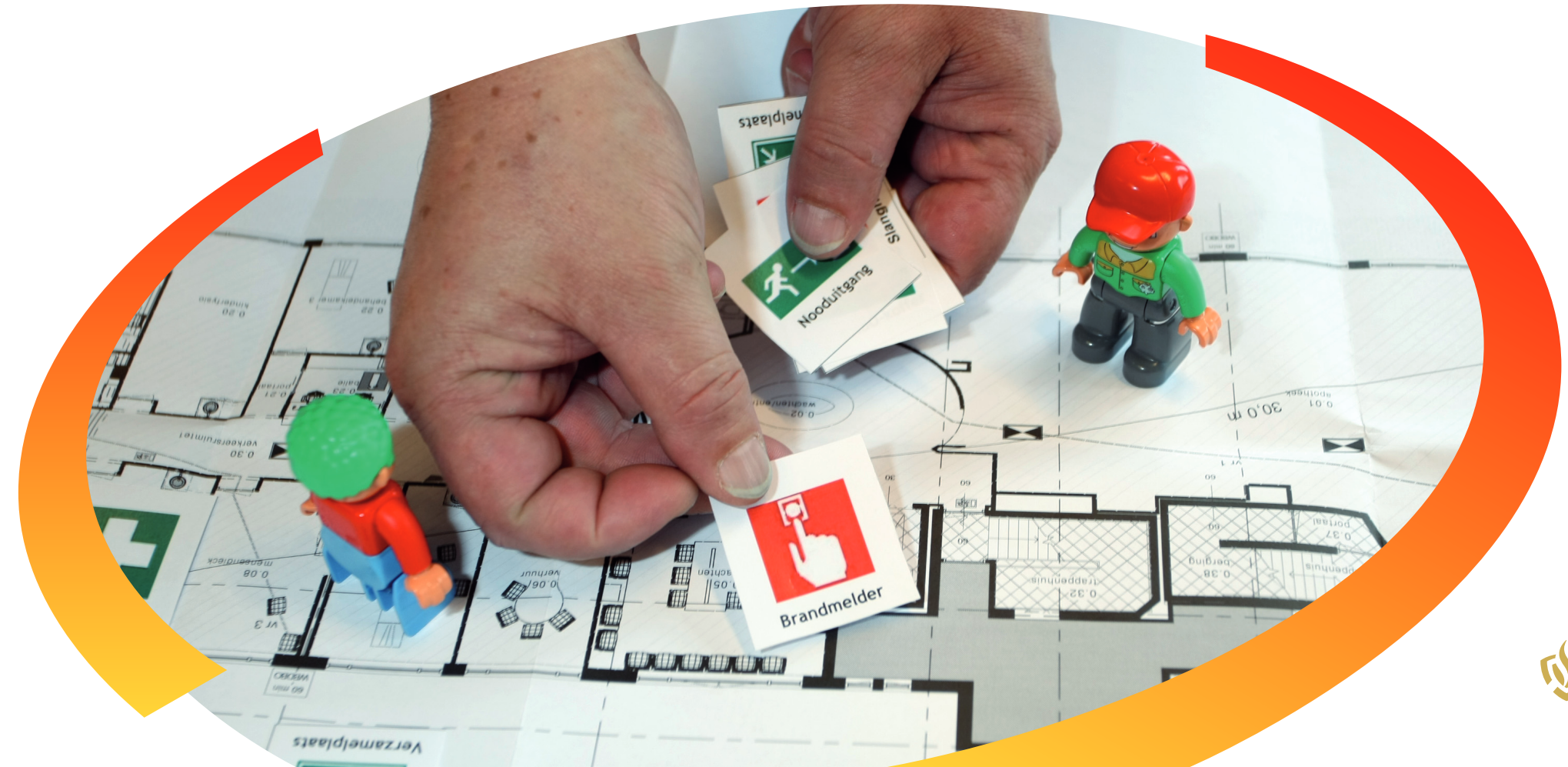
Table-topoefening: ontruimen in het klein